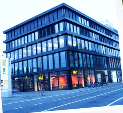
Noul nostru partener! Eurodesk Elveția

Termene limită Documentație Oportunități europene Semnalări Evenimente viitoare Tineret în Acțiune