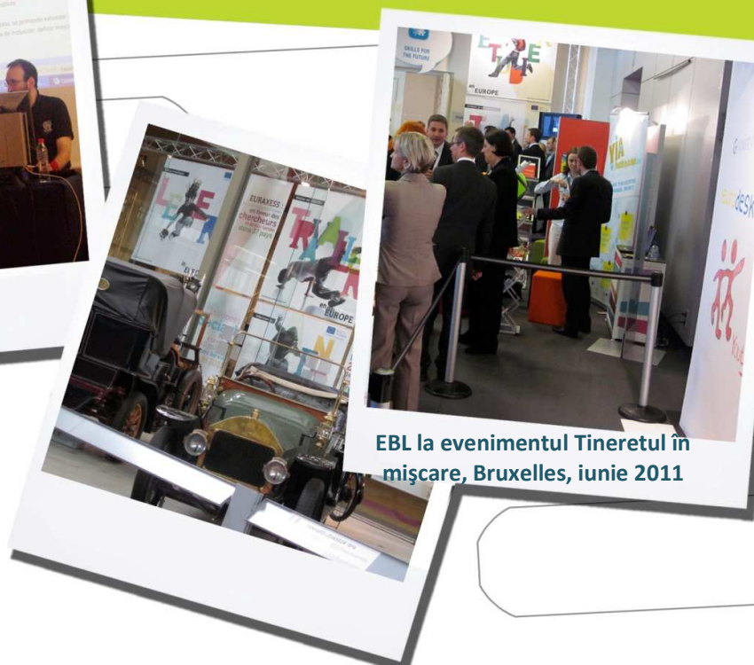
EBL la evenimentul Tineret în mișcare, Bruxelles, iunie 2011