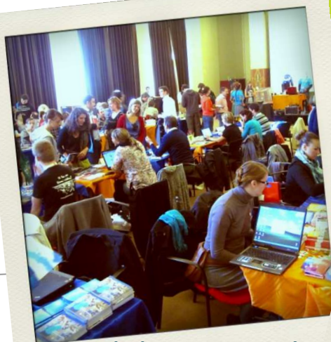
Eurodesk @ Go Strange !

Termene limită Documentație Oportunități europene Semnalări Evenimente viitoare Tineret în Acțiune