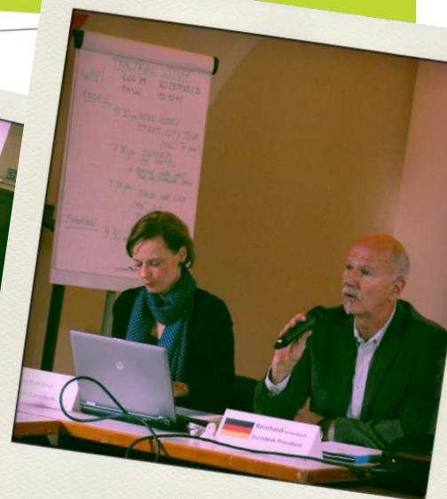
Întâlnirea rețelei europene Eurodesk, Antwerp